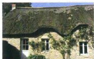
Pays de Loire